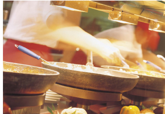
Plaque de cuisson design Magma pour la cuisine mobile ou le maintien au chaud des plats (modèle de 830 W)