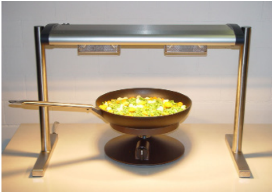
Utilisation d'une plaque de cuisson design Magma en combinaison avec le pont lumière/chauffant Beer Solaris